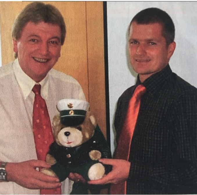
Gespräch mit dem GdP-Landesvorstand beim damaligen Innenminister Bouffier 2002

ne Kolleginnen und Kollegen doch immer im Brennpunkt. Nichts und niemandem ist es doch recht zu machen, wenn vorgefertigte Meinungen manifestiert sind. Wir halten uns an die verfassungsmäßigen Aufgaben, nicht mehr und nicht weniger. Klar ist aber auch, dass der Staat keine Schwäche zeigen sollte.