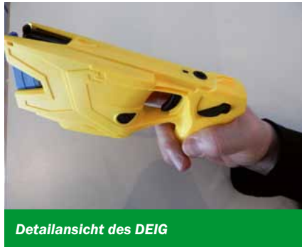
Detailansicht des DEIG

schaften hören, entbehren jedweder fachlichen Grundlage!“