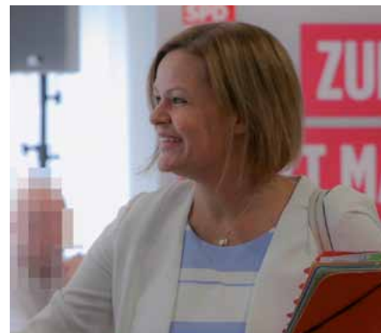
Nancy Faeser während der Pressekonferenz im Landtag

Wir sind gespannt, welche Vorschläge andere Parteien für den Poli-