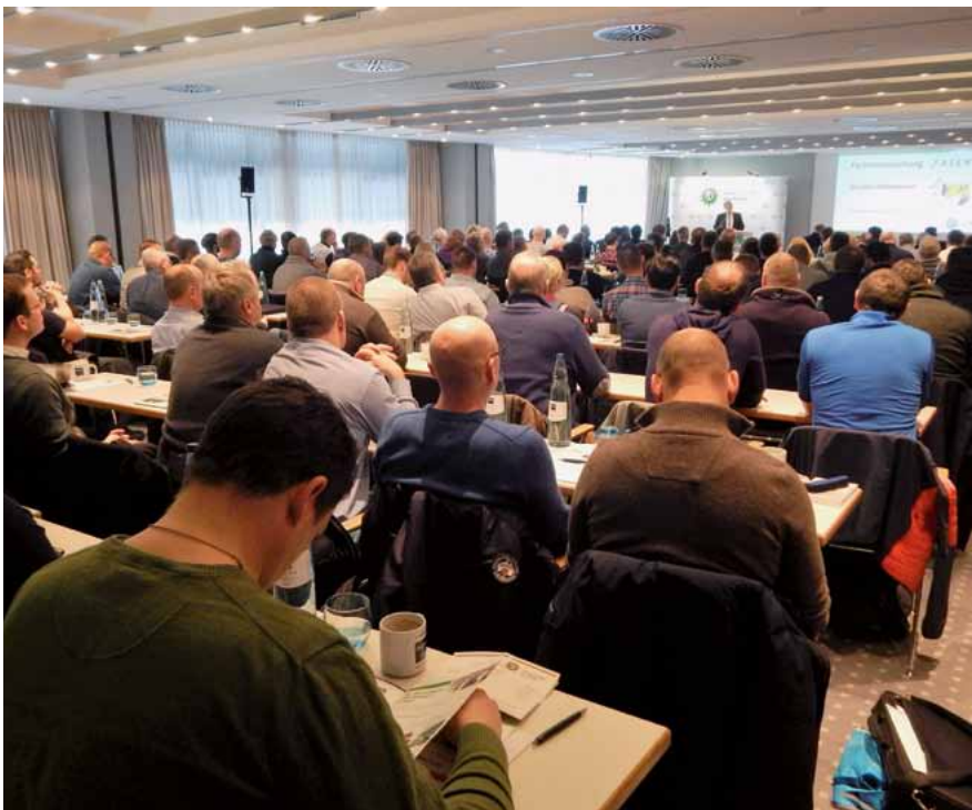
Hier wurde der Grundstein für die Einführung des DEIG gelegt: Die GdP-Fachtagung im Januar 2017