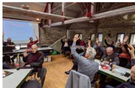
Wahlabstimmung der Teilnehmer

Nach der Darstellung und dem Bericht der Kassenprüfer*in konnte dann die Entlastung des Kassierers, der Kassiererin und den Vorständen ohne weiteren Gesprächsbedarf zugestimmt werden.